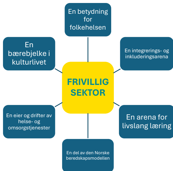
Figur 1: En oversikt over samfunnsområder hvor frivilligheten er en viktig aktør. Områdene beskrives i egne delkapitler under.

offentliges oppgave å legge til rette for at organisasjonene lykkes i dette, blant annet gjennom å føre en helhetlig frivillighetspolitikk.