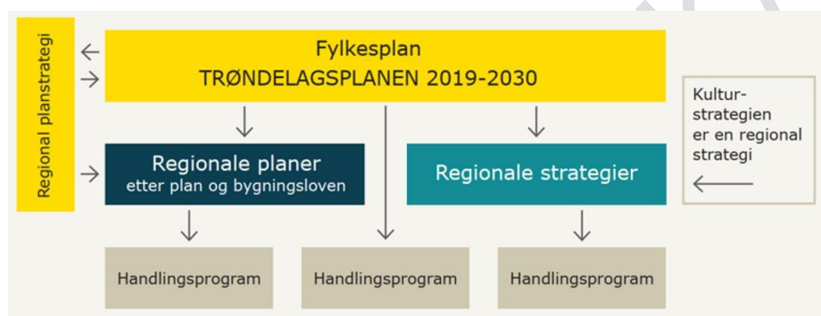
Figur 1: Oversikten viser sammenhengen mellom Trøndelag fylkeskommune sine ulike planer og strategier.

Handlingsplan for frivillighet i Trøndelag – Frivillig framtid er utarbeidet i henhold til planbehov vedtatt i Regional planstrategi (2024-2027) og er en del av operasjonaliseringen av Balansekunst - Kulturstrategi for Trøndelag 2019-2022 . Kulturstrategien bygger på mål og delmål i Vi knytter fylket sammen - TRØNDELAGSPLANEN 2019 - 2030