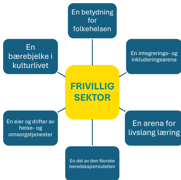
Figur 1: En oversikt over samfunnsområder hvor frivilligheten er en viktig aktør. Områdene beskrives i egne delkapitler under.

offentliges oppgave å legge til rette for at organisasjonene lykkes i dette, blant annet gjennom å føre en helhetlig frivillighetspolitikk.