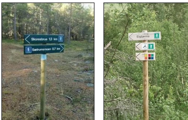
Bilde 1: Eksempel på ulik skilting for vandreturer sommerstid. Til venstre er det brukt mørkegrønne skilt med blå piktogram, mens det til høyre er brukt trehvite skilt med grønne piktogram og fargekoder.

God skilting og merking sammen med informasjon og kartoppslag bidrar til trygg og skånsom ferdsel i naturen. Skilting og merking bringer folk enklere ut i naturen og terskelen for å utøve fysisk aktivitet senkes. Når det gjelder utforming, er det er ikke brukt en felles standard for skilting og merking i nyere tid i Oppdal. Design og utseende varierer derfor avhengig av hvem som har vært tiltakshaver, hvilket gjør at designet på skiltingen er ulik rundt i kommunen. Det er i seg selv ikke en stor utfordring at skilt og tavles utformes ulikt, men det kan skape unødvendig forvirring og bidrar ikke til et helhetlig inntrykk av sti- og løypenettet i kommunen. Det bør derfor i fremtidig skilting etterstrebes at det brukes den samme standarden for å bidra til et helhetlig uttrykk og minske unødvendig forvirring. Designet på skiltene varierer også ut fra hvilken tidsepoke de ble satt opp på. DNT brukte tidligere røde skilt men bruker nå ubehandlet, impegregnert materiale med innfrest, svart skrift.