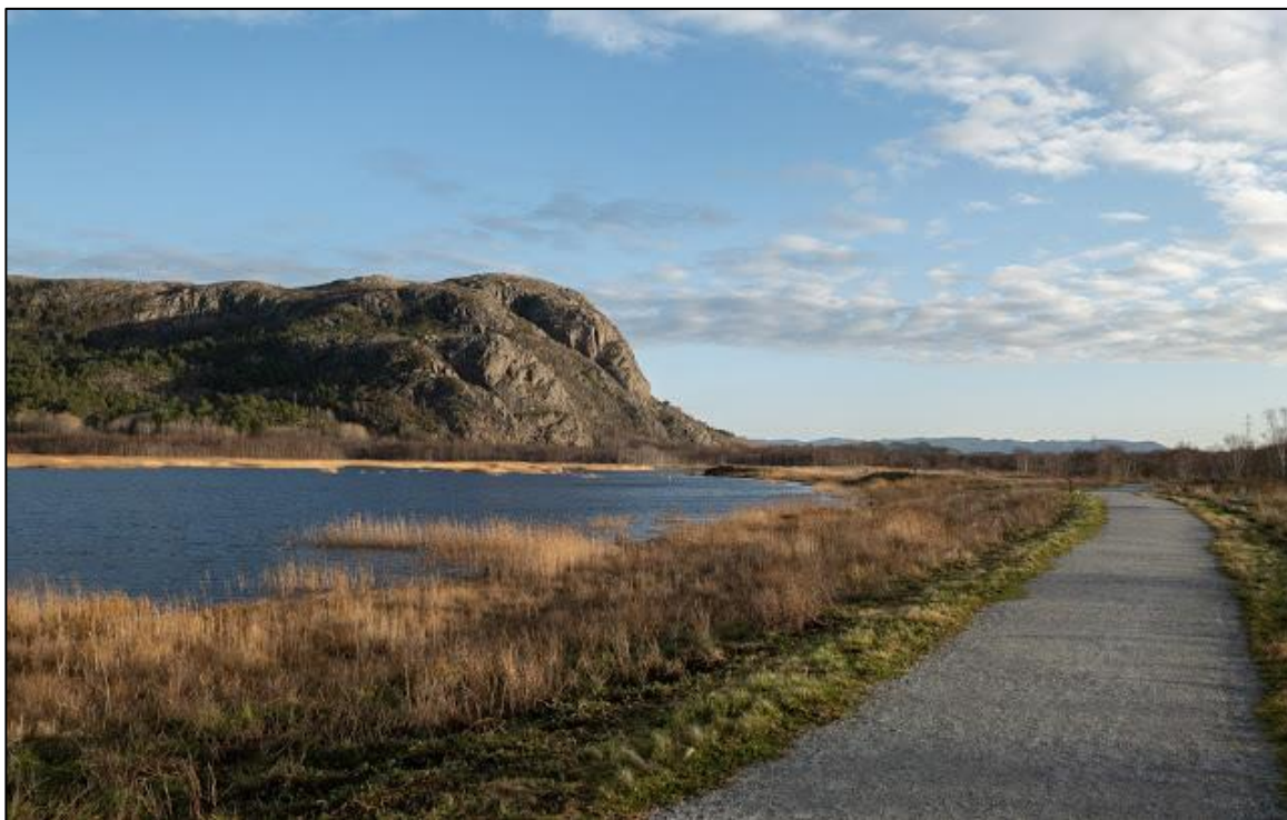
Rusasetvatnet, Ørland kommune.