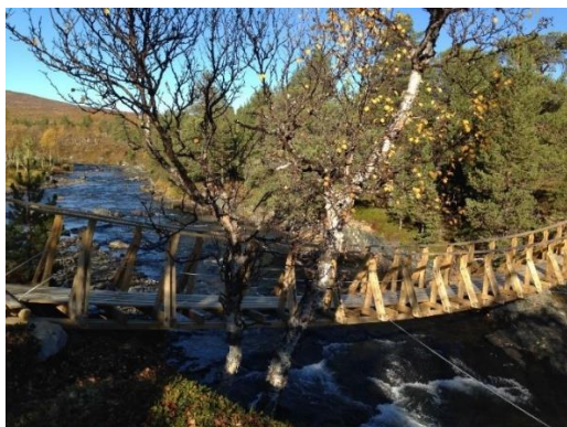
Bålplass og bru ved Minillstien