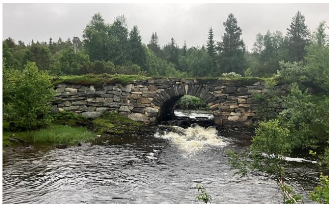
Døåbrua - Holtveien