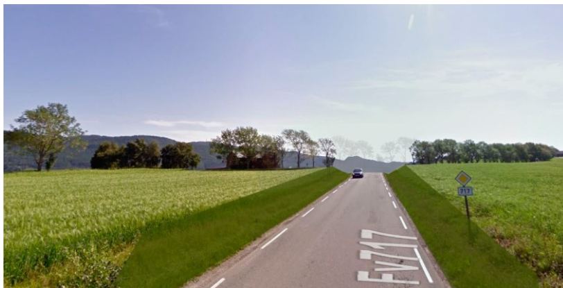
Illustrasjonsskisse fra søknaden, viser sideskråning 1:2 der ny veg ligger som et kutt i kulturlandskapet.

Her lages den nye vegen med vegskråninger på 1:2 helning. Ved å lage bratte skjæringer fjernes et mindre antall trær, og mer av det opprinnelige terrenget og større deler av vegen kan bevares. Ulempen med dette alternativet er at skråningene blir unaturlig bratte og vil fremheve det inngrepet den nye vegen faktisk er. I tillegg vil de store skjæringene danne en barriere og et permanent brudd i den gamle ferdselsåren. Alternativ 1 medfører behov for å fjerne 5 – 7 trær i alléen.