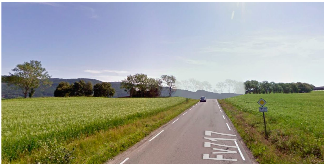
Illustrasjon fra søknaden som viser sideskråning 1:7. Her er vegskråningen fjernet og erstattet med åker.

Her lages den nye vegen med vegskråning med 1:7 helning. Her blir skråningen slakere, og området får en bedre geoteknisk stabilitet. Med en slakere skråning vil ikke den nye vegen oppleves som et like stort sår og inngrep i kulturlandskapet. Ved å velge dette alternativet kan det dyrkes helt inntil vegkanten, samt at ferdssåren og terrengryggen fremstår som en sammenhengende linje med visuell kontinuitet fra klosteret til Rissa. Ulempen med denne løsningen er at en lengre strekning av den gamle vegen må fjernes, og at flere trær, inntil 15 trær, må fjernes permanent.