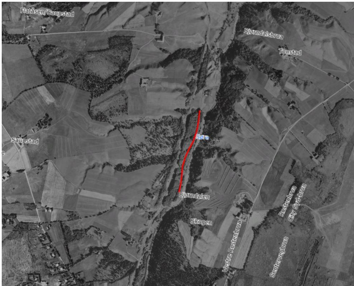
Figur 4 Bevart del av eldre veg lagt over ortofoto fra 1947