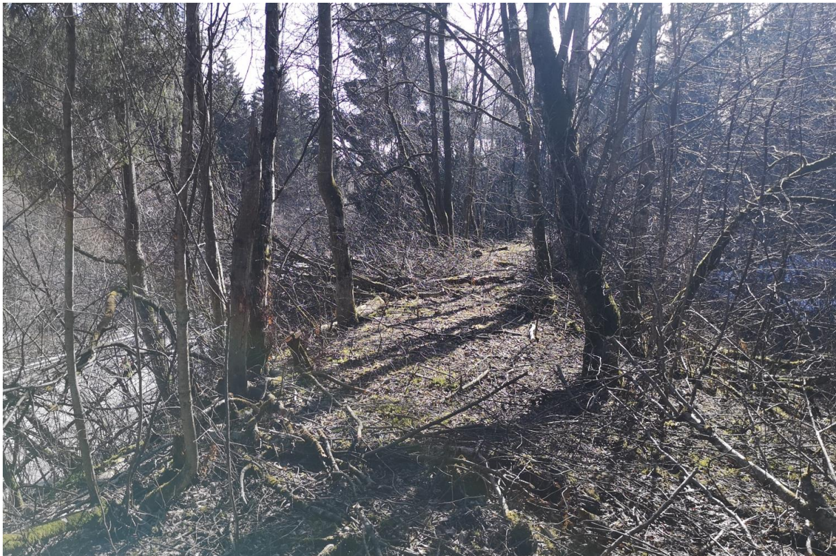
Figur 3 Del av eldre kjøreveg sett mot sør. Fv6682 til venstre i bildet.